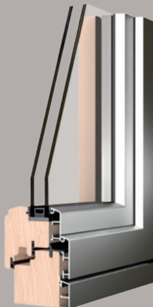
Sistema 5000/S Quadra design moderno e linee squadrate

Il sistema 5000/S Quadra ha un design moderno con linee squadrate e si inserisce nella tradizione dei serramenti classici. La gamma dei profili è molto ampia ed è in grado di soddisfare ogni esigenza costruttiva. Nel sistema 5000/S Quadra può essere utilizzata la serie di accessori e guarnizioni che consente di evitare l'uso di viti nell'assemblaggio dei telai in alluminio sul legno, che permette un sensibile risparmio di tempo ed evita ogni possibilità di errore nel posizionamento delle clips.